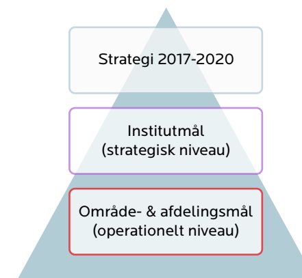
Figur 1: Målhierarki

Årets målopfyldeelse har været meget påvirket af pandemien, der har udfordret muligheden for at gennemføre de planlagte