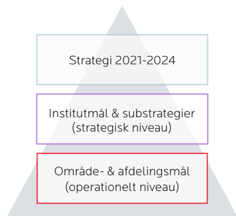
Figur 1: Målhierarki

Bestyrelsen fastsætter hvert år en række institutsmål, der har til hensigt at skabe den tilsigtede forandring, som fremgår af instituttets strategi. Institutmålene omsættes til konkrete indsatser i de enkelte afdelinger (se figur 1). :